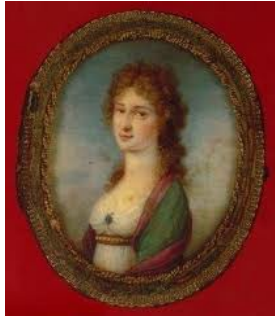
Gräfin Anna Maria von Erdödy

Der Briefwechsel zwischen Ludwig van Beethoven und der Gräfin Anna Maria Erdödy aus der Zeit um 1815 lässt die nahe Beziehung und die persönliche Achtung dieser beiden Personen erkennen. Ausgewählte Briefe sowie eine der Gräfin gewidmete Sonate von Ludwig van Beethoven sind ein Schwerpunkt des diesjährigen 9. Beethoven Kultur- & Genuss-Wandertages 2015.